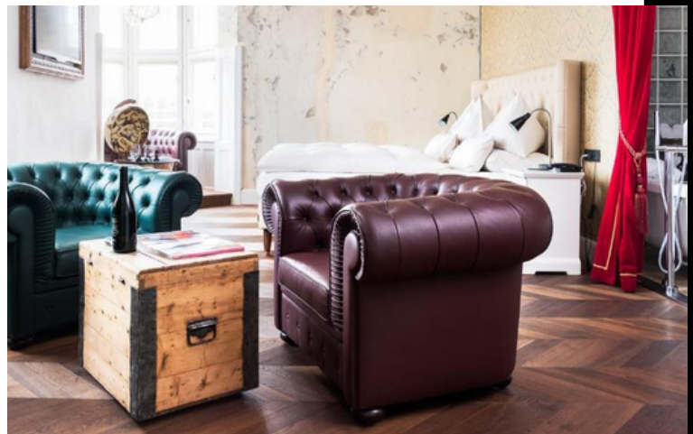
Grandhotel Wiesler Hotel

Nel pomeriggio, saremo pronti per iniziare il nostro viaggio verso il Grandhotel Wiesler di Graz, una delle perle dell'ospitalità austriaca. Qui, potrai goderti l'atmosfera unica e l'eleganza di un hotel di lusso, che rappresenta il perfetto rifugio dopo una giornata ricca di emozioni. Cena in hotel e pernottamento.