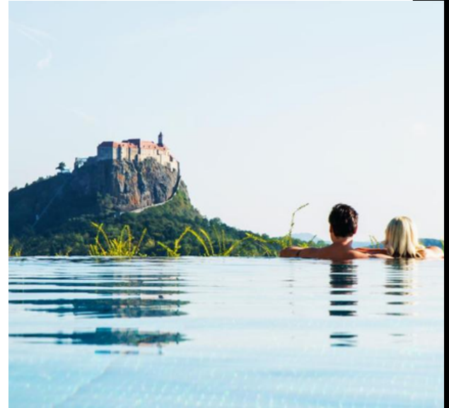
Hote Genusshotel Riegersburg